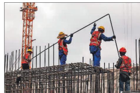
10月15日，在平陆运河青年枢纽工程工地，工人正在施工。