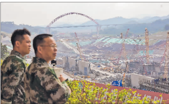
10月15日，在平陆运河马道枢纽工程工地，当地县政府工作人员远观施工现场。