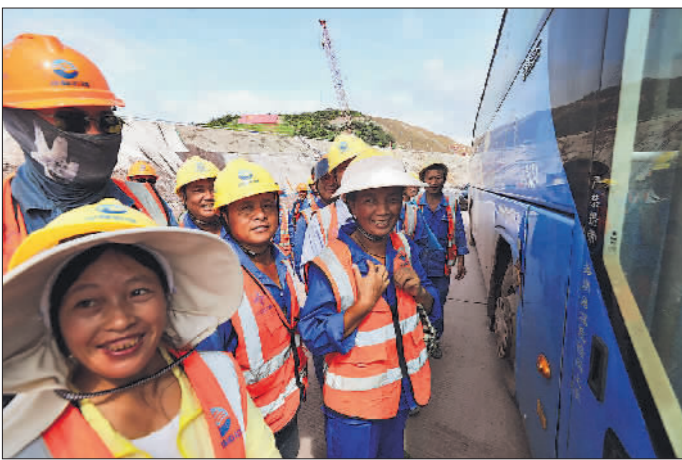
10月15日，在平陆运河青年枢纽工程工地，工人准备乘车回宿舍吃午饭。