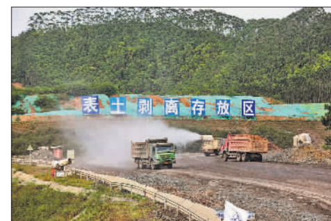
10月15日，在平陆运河马道枢纽工程工地，雾炮车对施工道路洒水雾降尘。