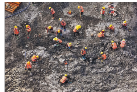
10月15日，在平陆运河马道枢纽工程工地，工人正在人工清理运河底部软性物质。