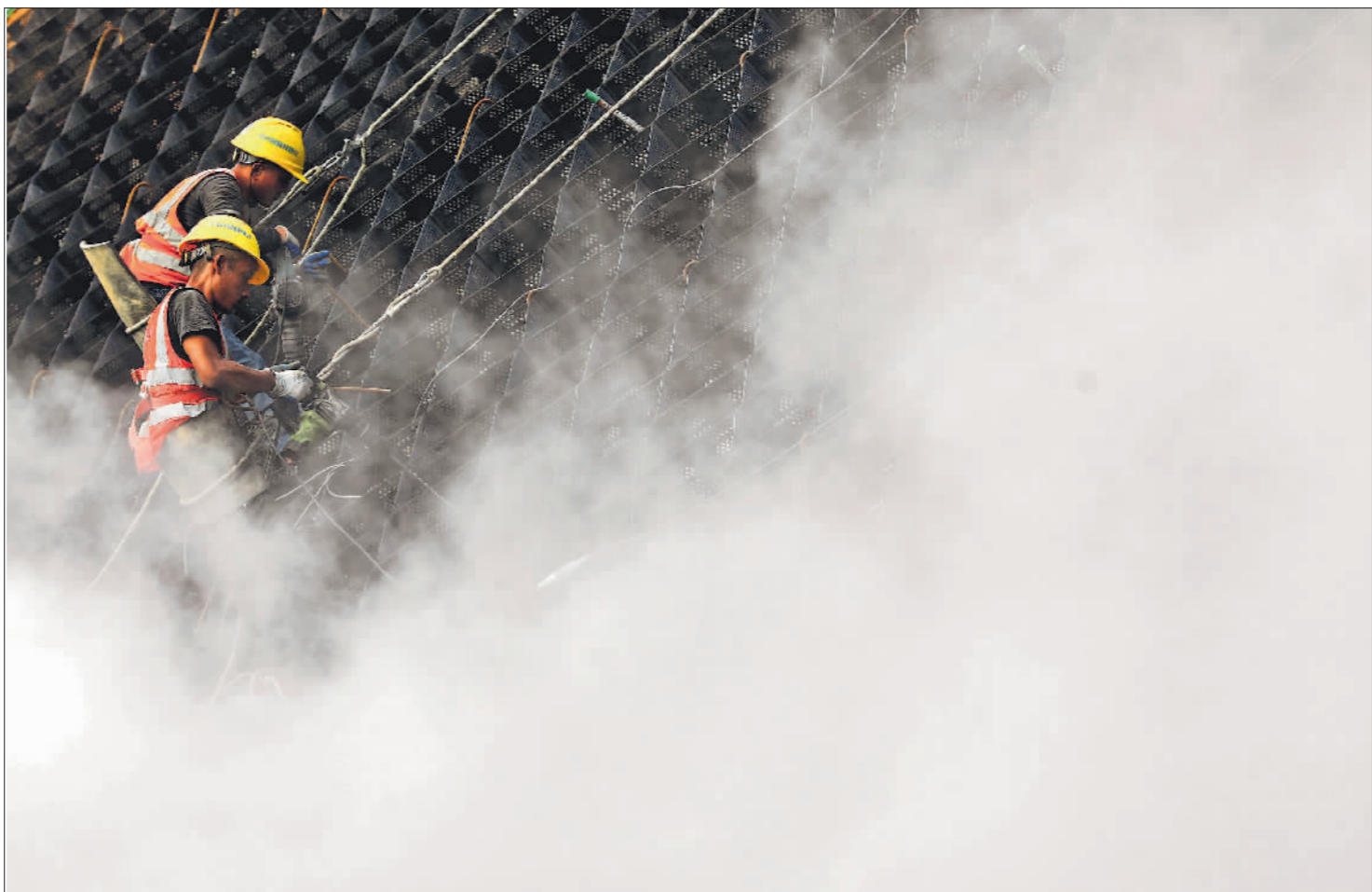
10月15日，在平陆运河马道枢纽工程工地，工人正在运河边坡钻孔安装固定桩杆。