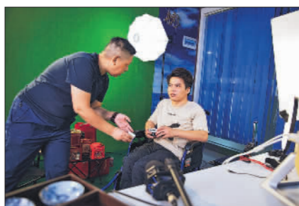
10月16日，梧州市残疾人辅助性就业基地模拟直播间的授课现场。